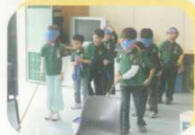
蒙著眼扮失明人士

小童軍亦有機會學習一些簡單的盲人點字，如數目字，並利用點字進行了一些遊戲，讓小童軍了解盲人如何閱讀及使用公共設施，例如升降機等。