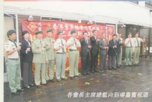
青少年活動與訓練部獲今年總監杯