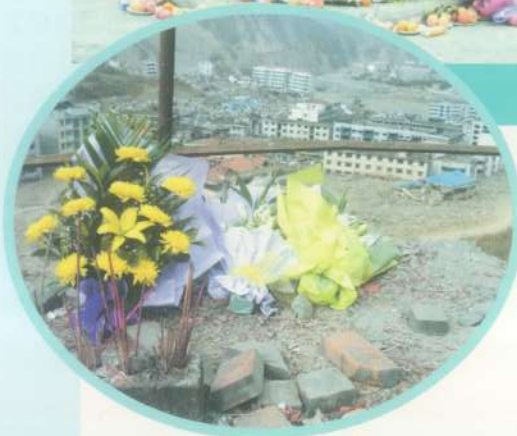
前來悼念的人送上鮮花致意