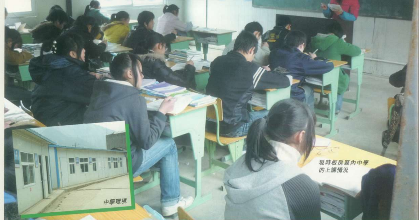
現時板房區內中學的上課情況